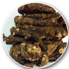
Phân loại củ