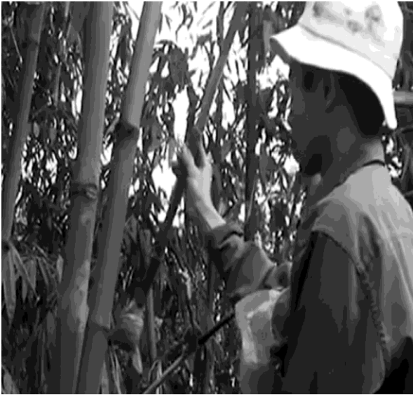
Hình 8: Dùng tay tách cành chiết