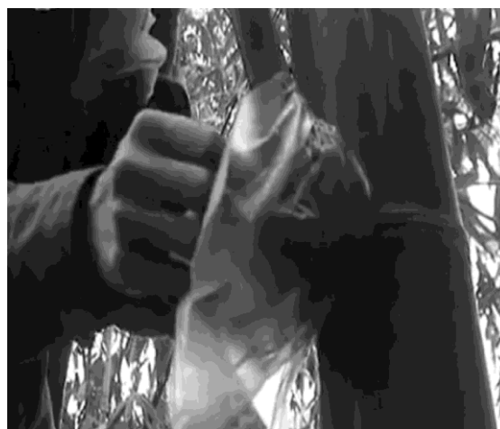
Hình 7: Dùng nilon quấn quanh bầu chiết

+ Sau khi chiết khoảng 20-30 ngày cành chiết ra rễ thì tách cành ra khỏi cây mẹ (dùng tay lắc nhẹ), khi rễ chuyển sang màu vàng và đang hình thành rễ thứ cấp thì cắt xuống và ươm tại vườn ươm.