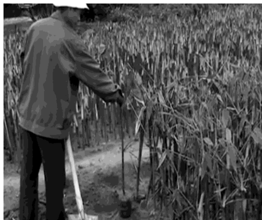
Hình 13: Xếp bầu vào luống giâm