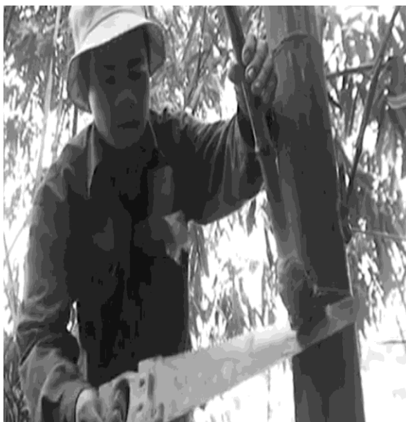
Hình 5: Cưa từ dưới lên

+ Dùng 150g - 200g hỗn hợp bùn ao trộn với rơm băm nhỏ theo tỷ lệ 2 bùn - 1 rơm, đủ ẩm cho 1 bầu chiết, dùng nilon kích thước 12 x 60cm bọc kín bầu chiết.