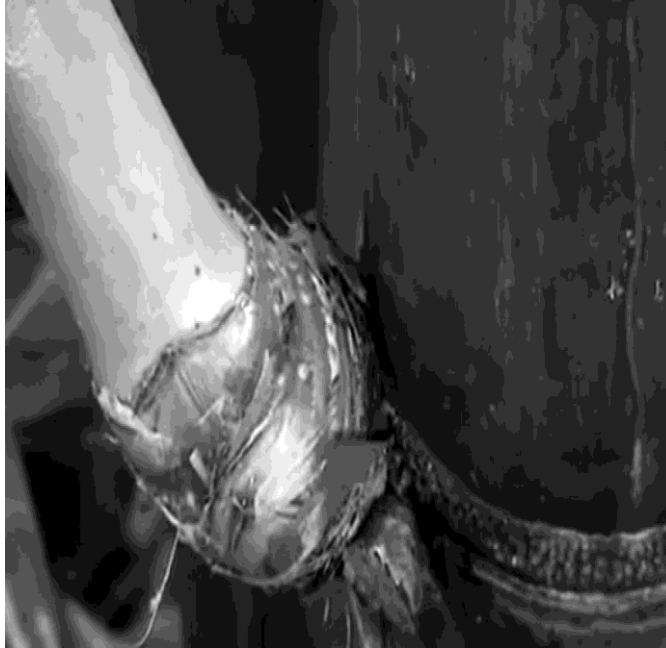
Hình 3. Cành chiết có mắt cua nổi rõ