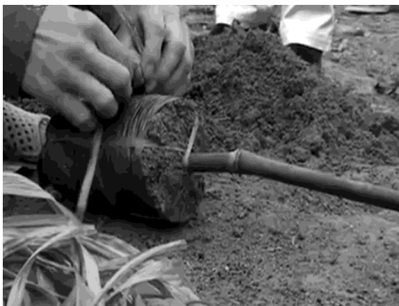
Hình 12: Quấn dây nilon quanh bầu