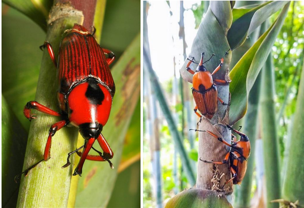
Hình 21. Vòi voi chân dài gây hại trên măng