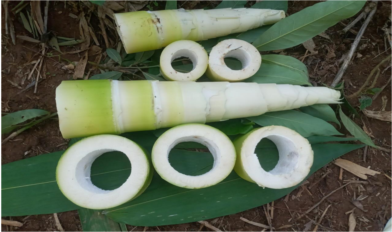
Hình 22: Dùng, dao chuyên dụng thu hái măng

- Sau thời vụ khai thác măng phải tiến hành tỉa bỏ những cây mẹ già cỗi \geq 2 năm tuổi, đánh bỏ các thân ngầm, chỉ để 6 - 8 cây bánh tẻ ( \leq 2 năm tuổi) cách thưa nhau 20 - 40cm/cây.