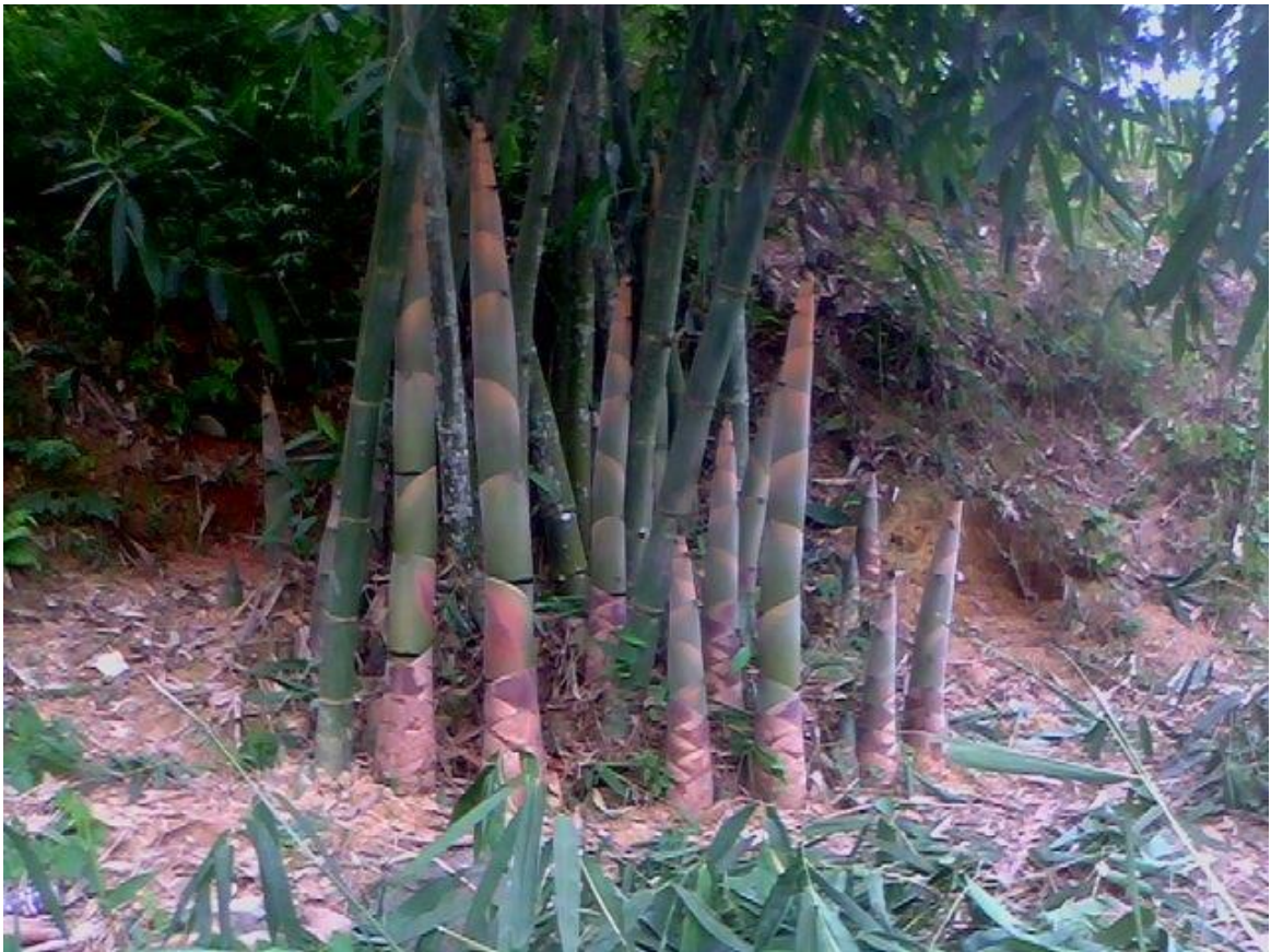
Hình 1: Bụi măng Bát Độ

- Công dụng chính của Măng Bát Độ là cung cấp măng ăn tươi, phơi khô hay đóng hộp xuất khẩu. Măng Bát Độ ngon không đắng, có màu trắng khi luộc, là thực phẩm được ưa chuộng ở nhiều nước trên thế giới.