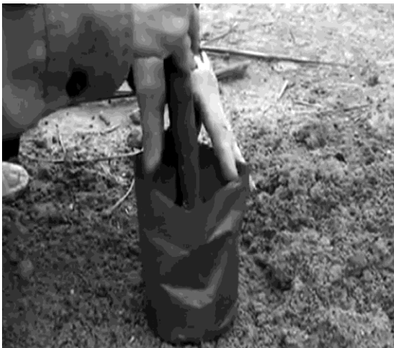
Hình 10: Đặt cây giữa bầu