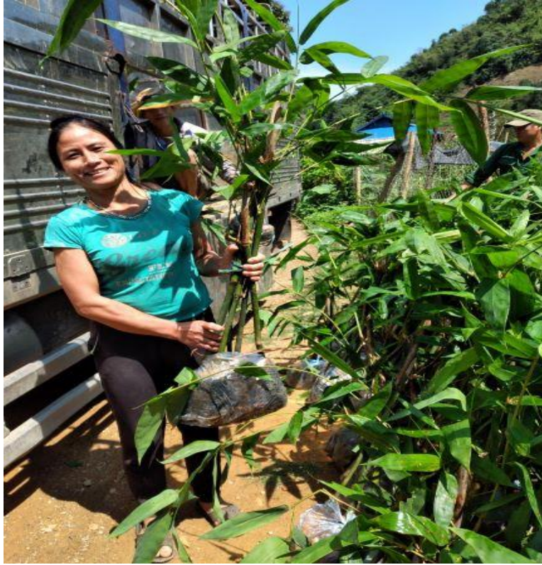
Hình 14: Cây đủ tiêu chuẩn xuất vườn