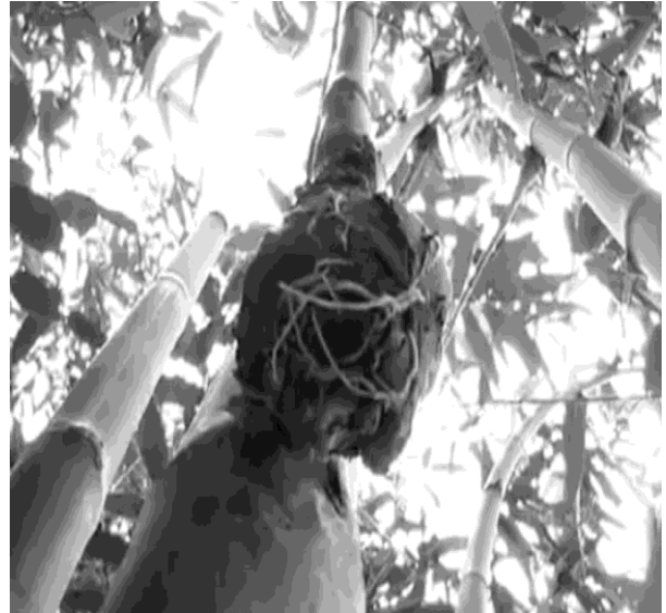
Hình 9: Rễ chuyển màu vàng