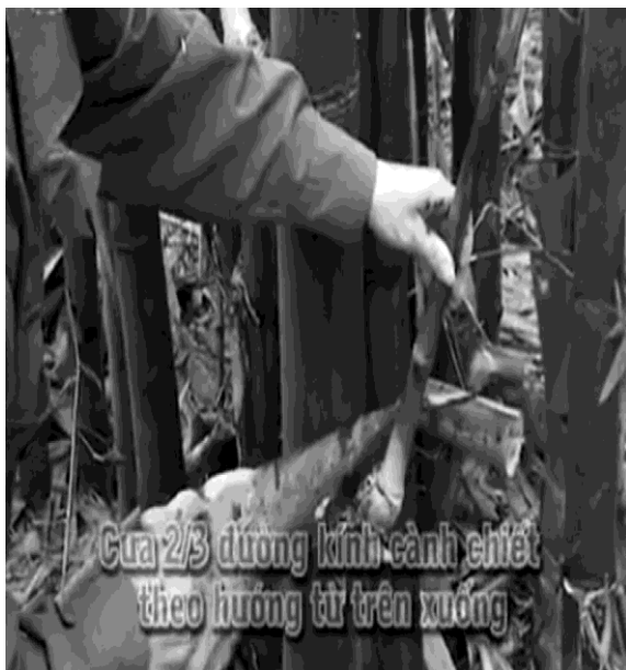
Hình 4.: Cưa từ trên xuống