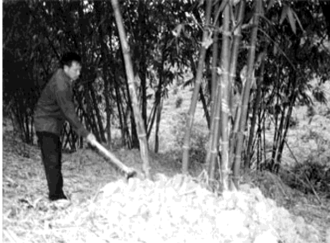
Hình 19: Tủ đất vào gốc Măng

Tháng 6, 7, 8: Hàng tháng bón phân phân nung chảy Văn Điển hoặc phân vi sinh với liều lượng 0,3 - 0,5 kg/cụm.