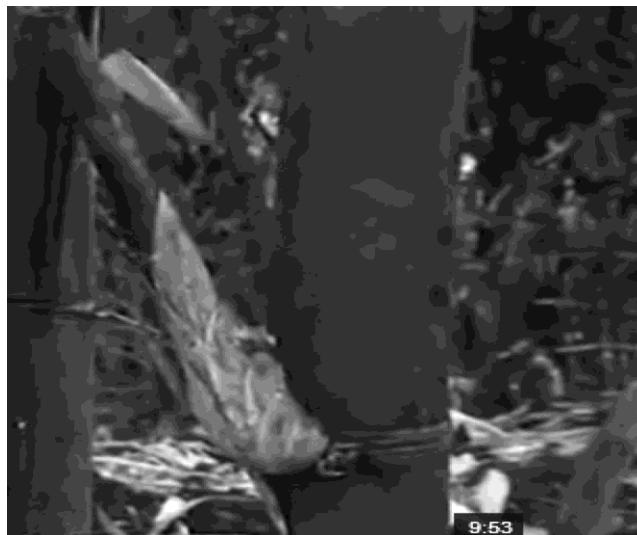
Hình 2. Đường kính cành chiết trên 1cm

+ Đường kính cành trên 1cm, cành đã tỏa ra hết lá. Mát cua trên đùi gà không bị sâu thối và nổi rõ.