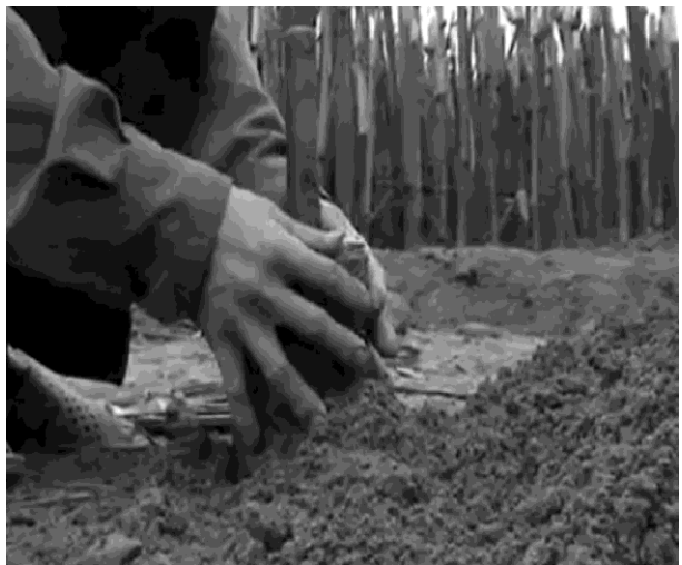
Hình 11: Ấn chặt bầu