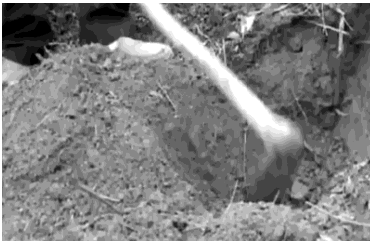
Hình 17: Lớp đất mặt để một bên

- Chỗ đất xấu có thể đào hố rộng hơn: Chiều rộng hố: 1m; Chiều dài: 1m; Chiều sâu: 70cm. Lớp đất mặt cuốc trước, để ở một bên; lớp đất cuốc sau lớp đất mặt để ra một bên.