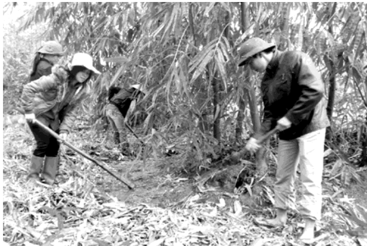
Hình 20: Làm cỏ quanh bụi Măng

Tháng 1: Xới đất để lộ gốc bắt đầu chu kỳ chăm sóc năm tiếp theo