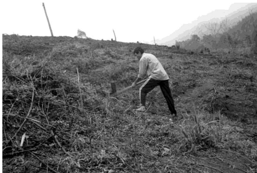
Hình 15: Phát dọn thực bì

Chú ý: Xử lý thực bì trước khi trồng 1 tháng.