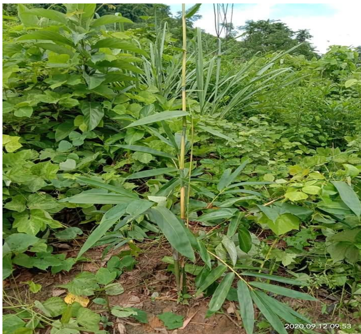
Hình 18: Làm cỏ sau trồng 1 tháng

Lần 1: Sau khi trồng 1 tháng, trồng dặm, làm cỏ, xới xáo đất xung quanh gốc trồng 1m.