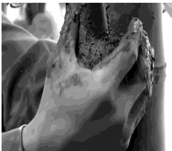
Hình 6: Bó bầu chiết

+ Dùng 150g - 200g hỗn hợp bùn ao trộn với rơm băm nhỏ theo tỷ lệ 2 bùn - 1 rơm, đủ ẩm cho 1 bầu chiết, dùng nilon kích thước 12 x 60cm bọc kín bầu chiết.